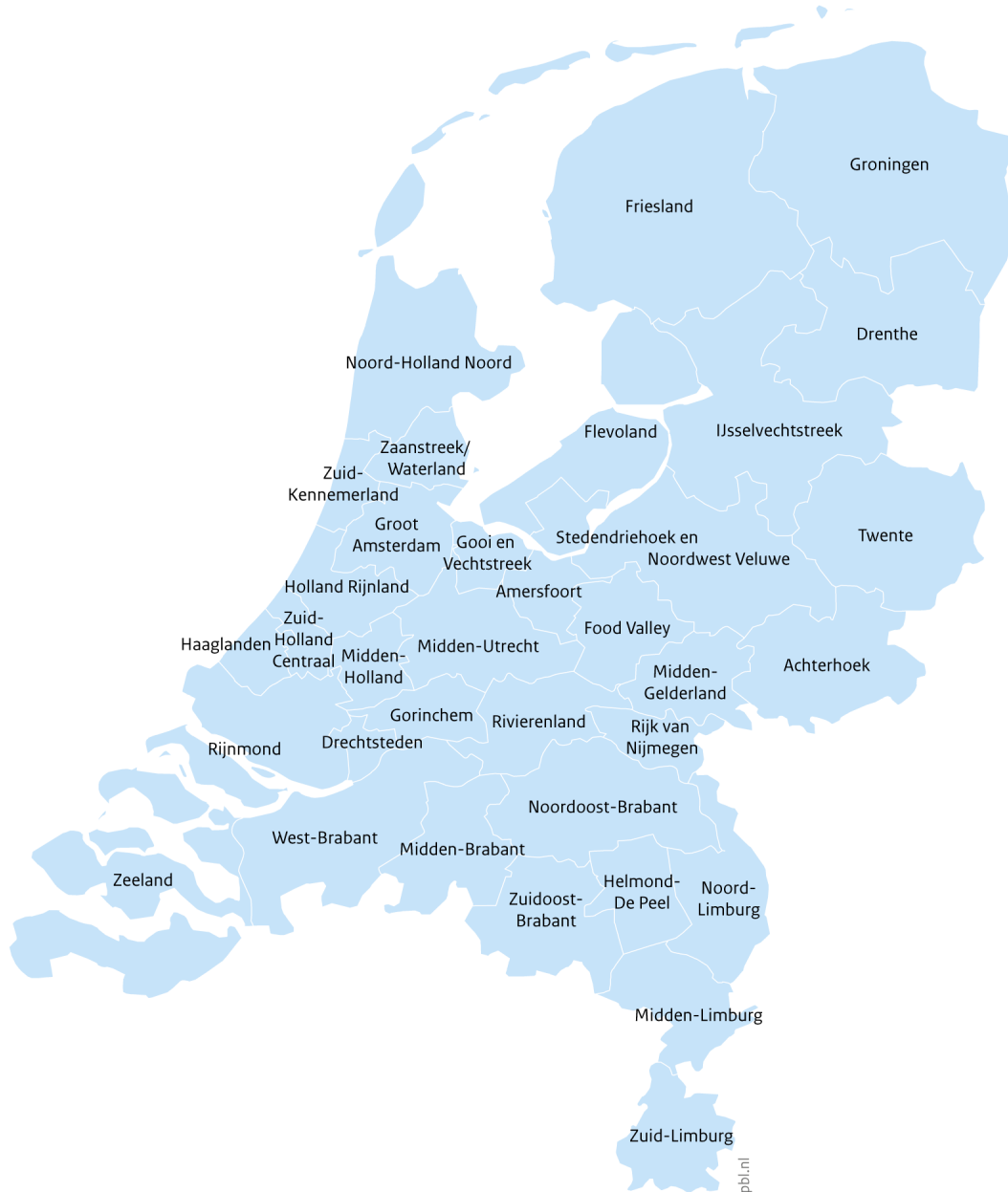
Figuur B1 Arbeidsmarktregio's