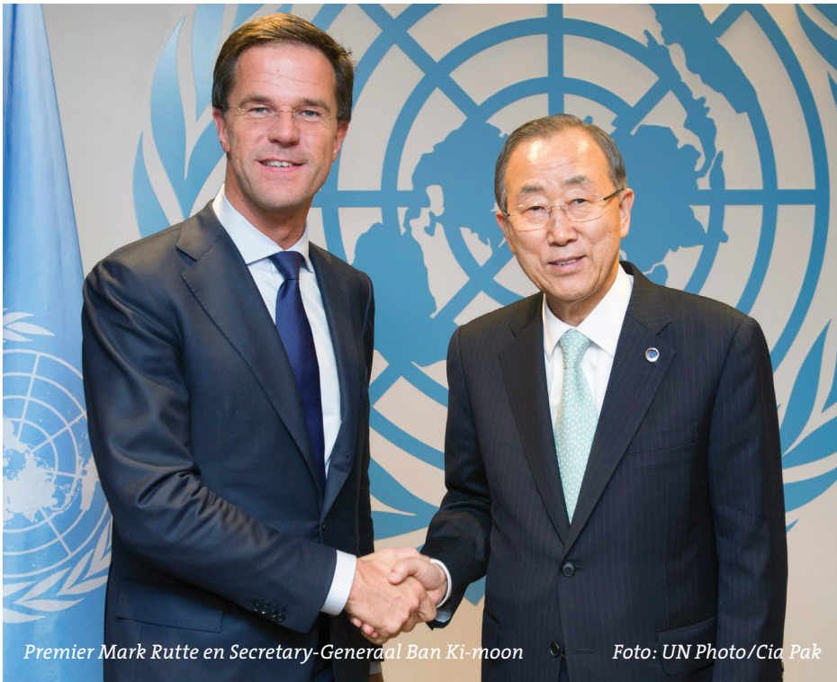
Premier Mark Rutte en Secretary-Generaal Ban Ki-moon

patie van partijen in de samenleving, zoals burgers, ngo's en bedrijven, zowel bij het vaststellen van de ambities (waar willen we als samenleving naar toe?) als bij de implementatie (hoe willen we dit bereiken?) en de monitoring (bereiken we wat we willen?). Een heldere en herkenbare langetermijnvisie kan partijen positief uitdagen en inspireren tot verdere actie en innovatie op hun eigen werkterrein, interessegebied of deskundigheid. In de uitvoering kan de overheid nationale initiatieven actief faciliteren.